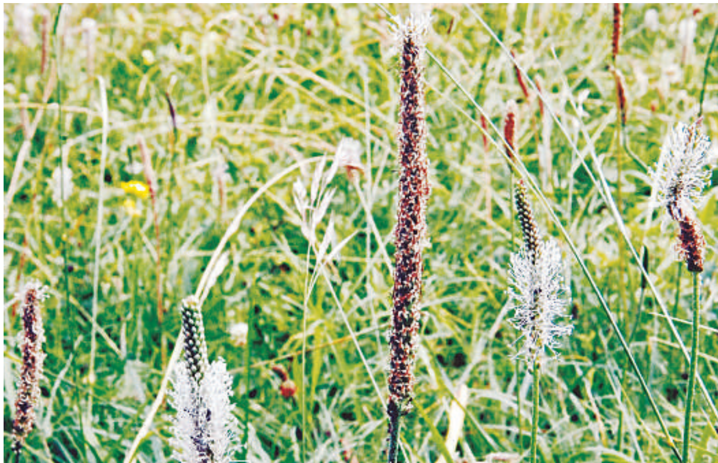
C'est pendant la floraison de plantain, de juin à septembre, que l'on cueille les feuilles qui servent en phytothérapie.

Le truc vaut aussi en cas de piqûres d'orties ou d'insectes